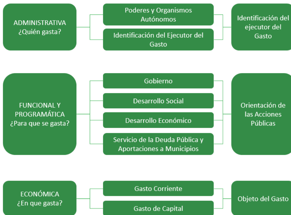
DIAGRAMA 1. DIMENSIONES DEL GASTO

Durante el proceso de presupuestación se asigna la estimación financiera anticipada de los recursos humanos y materiales necesarios para el cumplimiento de los programas presupuestarios establecidos por las Dependencias, Entidades y Órganos Autónomos Estatales. En el siguiente esquema se ilustra en forma gráfica las Dimensiones del Gasto.